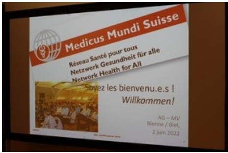
Photo : L'Assemblée générale du Réseau Medicus Mundi Suisse

Diese Meldung kann unter https://www.presseportal.ch/fr/pm/100002268/100907839 abgerufen werden.