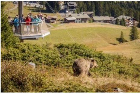
Dans le paysage naturel des montagnes d'Arosa, les ours peuvent laisser leur triste passé derrière eux et mener une vie proche de la nature.