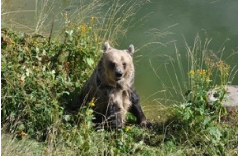
Lors des visites guidées, l'équipe d'Arosa Terre des Ours fournit aux visiteurs des informations de première main sur les ours. L'accent est mis sur les questions de protection animale.

Diese Meldung kann unter https://www.presseportal.ch/fr/pm/100004691/100910032 abgerufen werden.