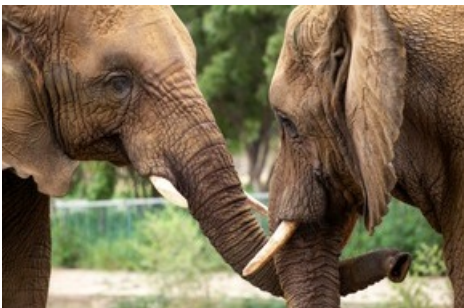
Séparées depuis 14 ans, Madhubala et ses sœurs seront bientôt réunies.

Diese Meldung kann unter https://www.presseportal.ch/fr/pm/100004691/100910558 abgerufen werden.