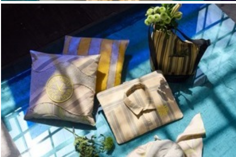
Upcycling Accessoires / BERNINA Suisse SA