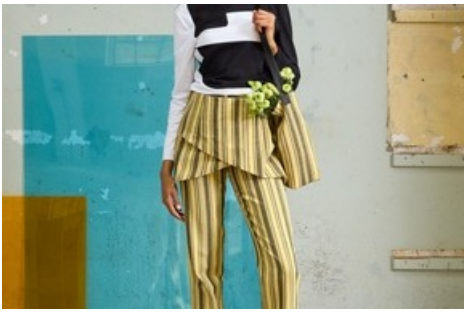
Woman Look 1 / BERNINA Suisse SA