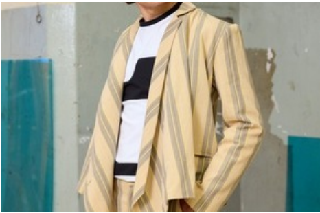
Man Look 1 / BERNINA Suisse SA