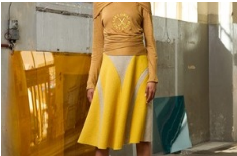
Woman Look 3 / BERNINA Suisse SA

Diese Meldung kann unter https://www.presseportal.ch/fr/pm/100019087/100910893 abgerufen werden.