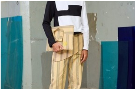
Man Look 1 / BERNINA Suisse SA