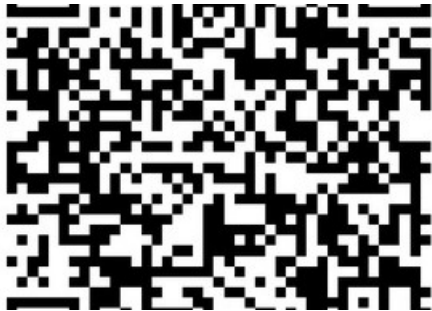
Avec ce code QR, la sculpture peut être visualisée et photographiée.