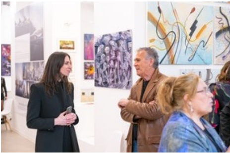
La commissaire Giulia Tassi.