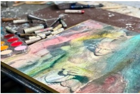
L'œuvre d'art originale et l'œuvre d'art virtuelle sont faites à la main. Aucune intelligence artificielle n'a été utilisée. Crédit : Sarah Montani