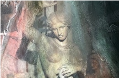
Œuvre originale de l'artiste Sarah Montani, encaustique et huile sur bois, 2023, à la Medina Art Gallery de Rome. Crédits : Sarah Montani