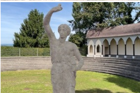
La sculpture en réalité augmentée. Elle peut être visualisée avec n'importe quel smartphone.