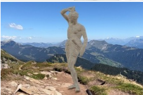
La sculpture en réalité augmentée. Elle peut être visualisée avec n'importe quel smartphone. Crédits : Sarah Montani