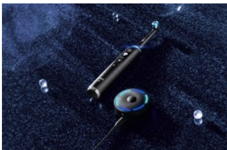
Oral-B fête les 60 ans de la brosse à dents électrique

Diese Meldung kann unter https://www.presseportal.ch/fr/pm/100096081/100911699 abgerufen werden.