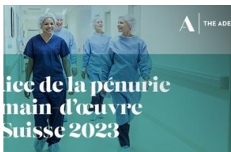
Indice de la pénurie de main-d'œuvre en Suisse, job index et taux de c