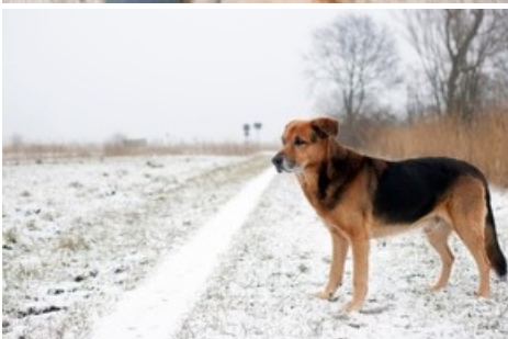
Les conditions hivernales mettent les pattes des chiens à rude épreuve.

Diese Meldung kann unter https://www.presseportal.ch/fr/pm/100004691/100915107 abgerufen werden.