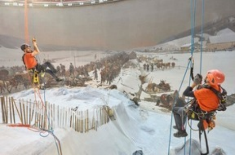
Cordistes lors de travaux d'installation devant le Panorama Bourbaki, janvier 2024.