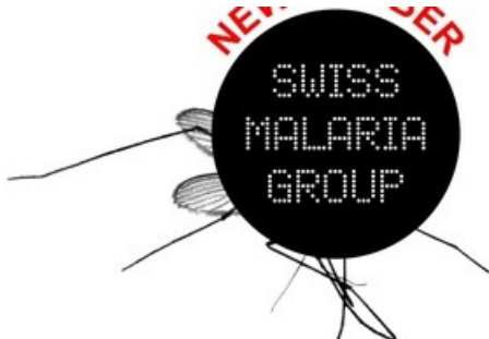
SMG New member