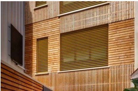
Griesser Showpass BCN.

Diese Meldung kann unter https://www.presseportal.ch/fr/pm/100082361/100916011 abgerufen werden.