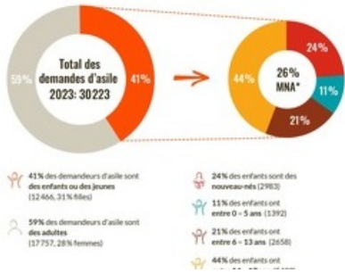
Statistiques des demandes d'asile en suisse 2023 concernant les enfants et jeunes mineurs

Diese Meldung kann unter https://www.presseportal.ch/fr/pm/100016257/100916117 abgerufen werden.