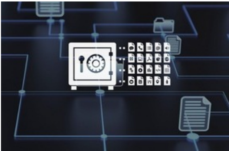
« Universal Archiving » avec Arcplace

Diese Meldung kann unter https://www.presseportal.ch/fr/pm/100083761/100916592 abgerufen werden.