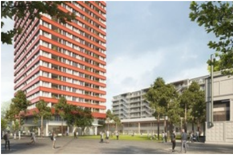
Site Zwhatt à la gare de Regensdorf (Zurich)