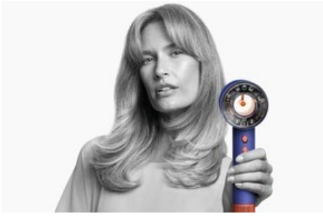
Light Box White BG RGB 248/248/248 C3 M2 Y2 K0

Diese Meldung kann unter https://www.presseportal.ch/fr/pm/100064110/100917131 abgerufen werden.