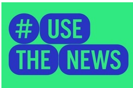
Texte complémentaire par ots et sur www.presseportal.ch/fr/nr/100014224 / L'utilisation de cette image à des fins éditoriales est autorisée et gratuite, pourvu que toutes les conditions d'utilisation soient respectées. La publication doit inclure le crédit de l'image.

Diese Meldung kann unter https://www.presseportal.ch/fr/pm/100014224/100917853 abgerufen werden.