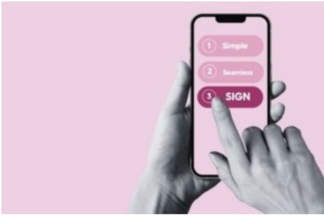
SIGN - la nouvelle génération de signature numérique

Diese Meldung kann unter https://www.presseportal.ch/fr/pm/100090319/100918134 abgerufen werden.