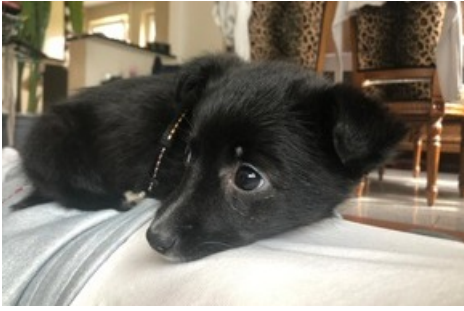
L'achat d'un chiot sur internet comporte des risques.