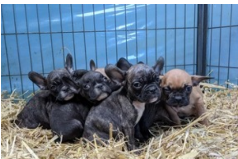
Acquérir un chiot comporte de grands risques, surtout lors d'un achat en ligne.