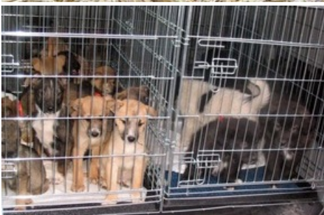
De nombreux chiots sont élevés dans des élevages douteux en vue d'être vendus dans notre pays.