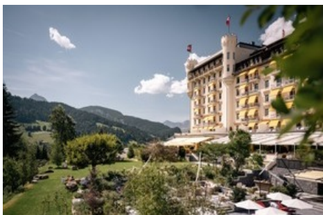
Le Gstaad Palace décroche à nouveau la première place parmi les meilleurs hôtels de vacances de Suisse dans le classement de BILANZ.