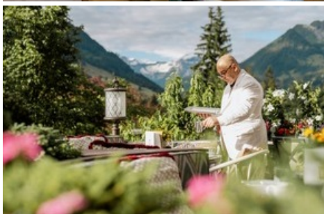
Sur La Grande Terrasse, la vue s'ouvre sur le décor magique des montagnes.