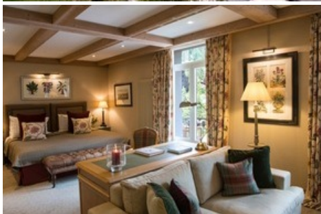
Classic Junior Suite avec vue sur le lointain.