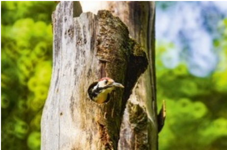
Le pic à dos blanc raffole des coléoptères saproxyliques.