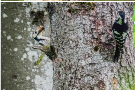
Le pic à dos blanc raffole des coléoptères saproxyliques.

Diese Meldung kann unter https://www.presseportal.ch/fr/pm/100015692/100924329 abgerufen werden.